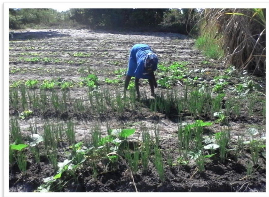
Figura n°2: agricultora fazendo a sacha