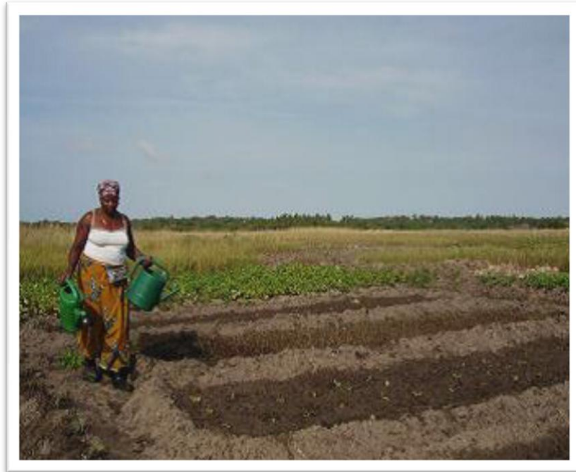
Figura n°1: agricultora regando as culturas