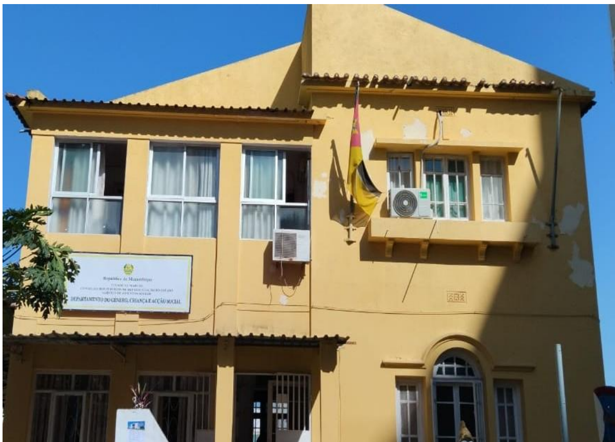
Figura 1: Imagem do DGCAS