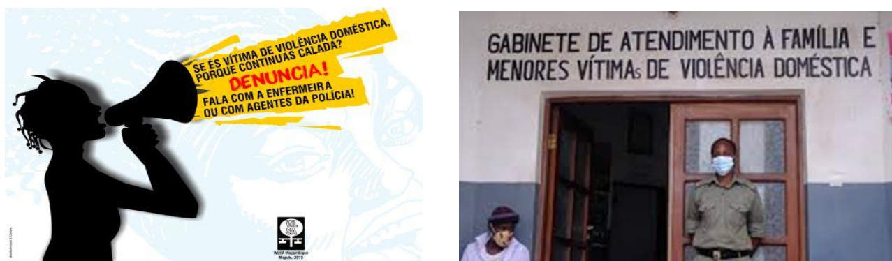
Figura 6 Imagens que retratam casos de denuncias