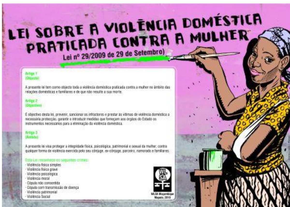
Figura 3 Imagem de campanha de sensibilização para denúncias de casos de violência