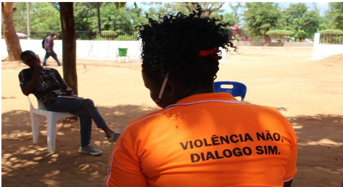
Figura 7 Imagem que incentiva dialogo e não a violência