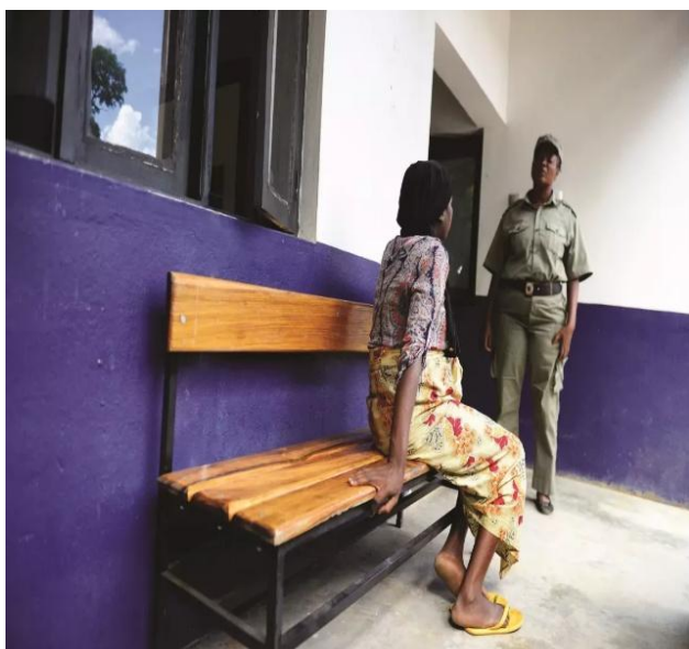
Figura 4 Imagem que retrata casos de denuncias de violência

Embora o Gabinete haja conforme a lei, dê assistência jurídica e abrigo temporário as mulheres vítimas, ainda há necessidade do Governo redobrar esforço e emponderar as mulher em situação de violência, capacitando-as com mercado de trabalho, de modo que ao sair do abrigo temporário não voltem para o agressor, porque uma das coisas que as mulheres acabam abrindo mão da violência e suportar no silencio, é a falta de recursos próprios para enfrentar a vida e cuidar dos filhos, mulheres dependentes financeiramente, pessoas sem teto, e nesses condições se não for viver na rua e submeter-se a actos de prostituição, volta as mãos do agressor.