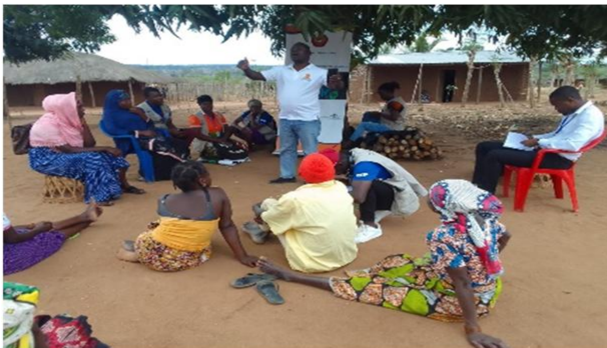
Figura 2: Imagem de campanha de sensibilização para denúncias de casos de violência