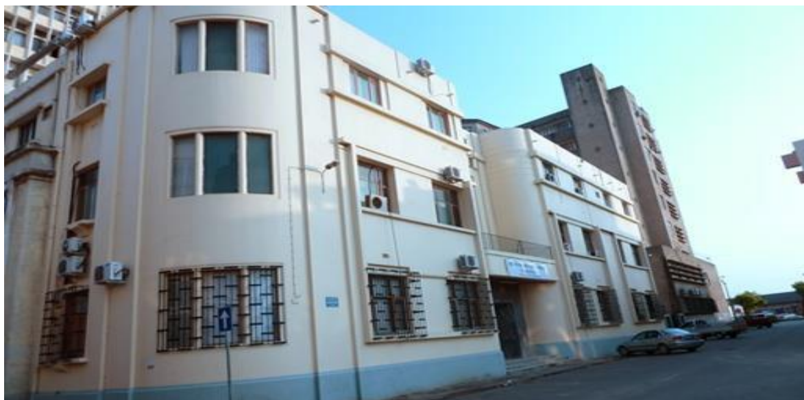
Figura-1 edifício onde funciona a Sede do Arquivo Histórico de Moçambique- localizado na Travessa de Varietá