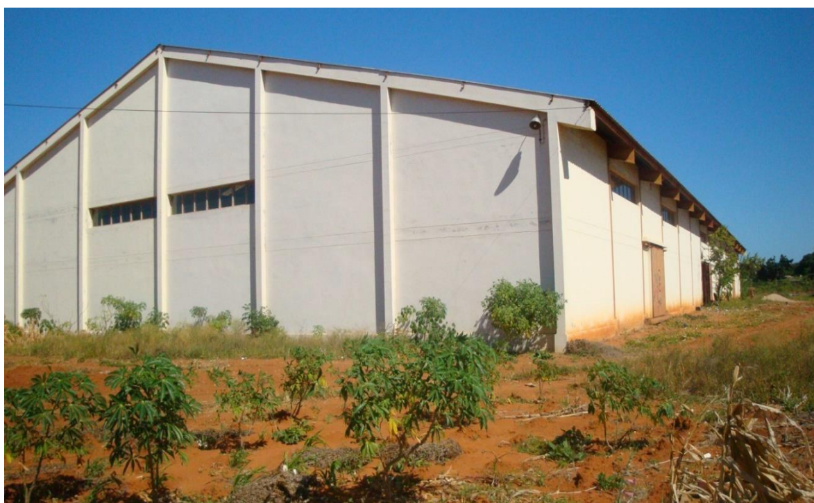
Figura:2 Departamento de Arquivos Permanentes (DAP) localizado no Campus da UEM