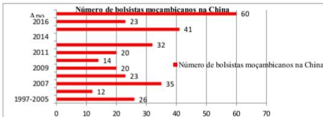
Figura 1- Número de bolsistas moçambicanos na China