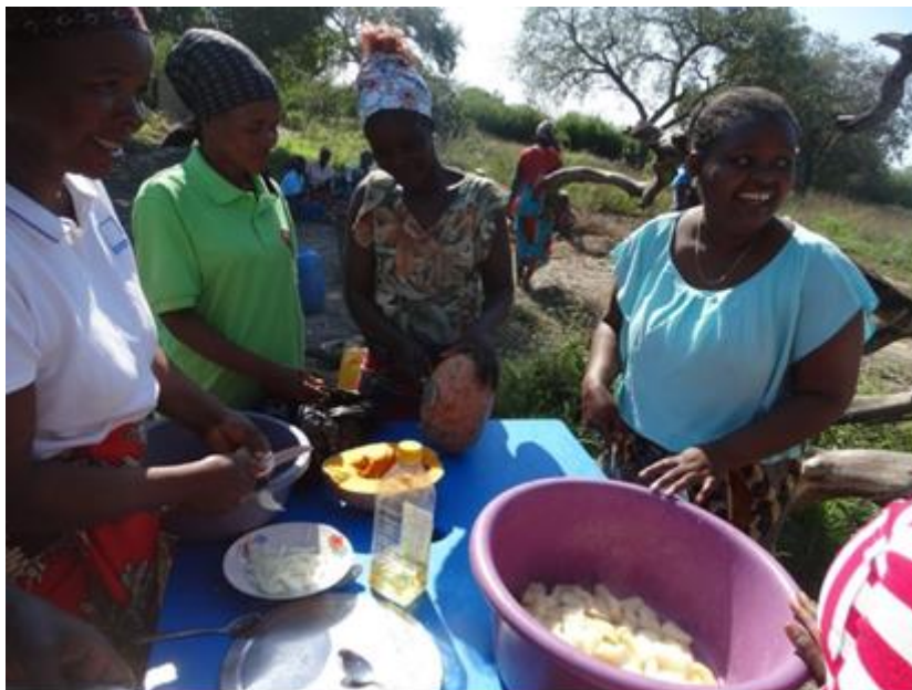
Figura 4: Camponeses da UCAM na Formação em Nutrição