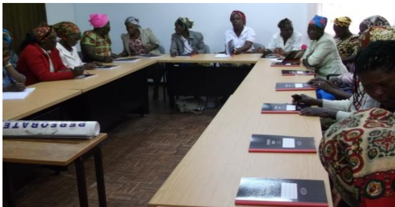
Figura 3: Camponeses na Formação sobre liderança