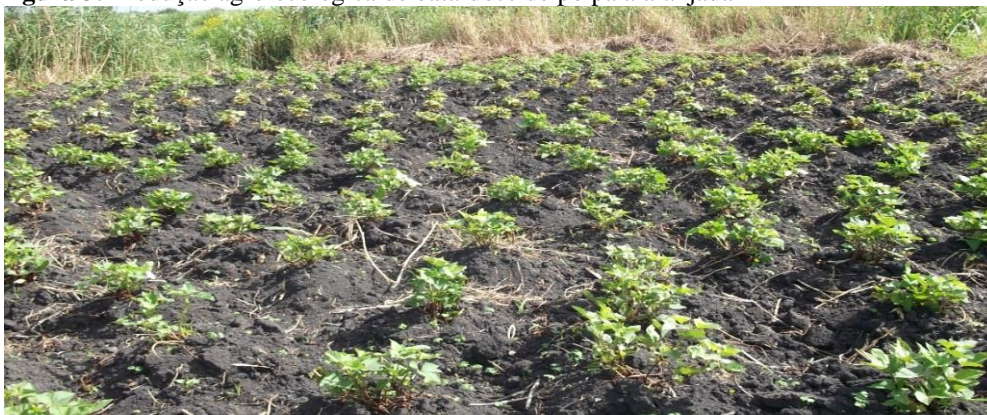
Figura 3: Produção agro-ecologica de bata-doce de polpa alaranjada