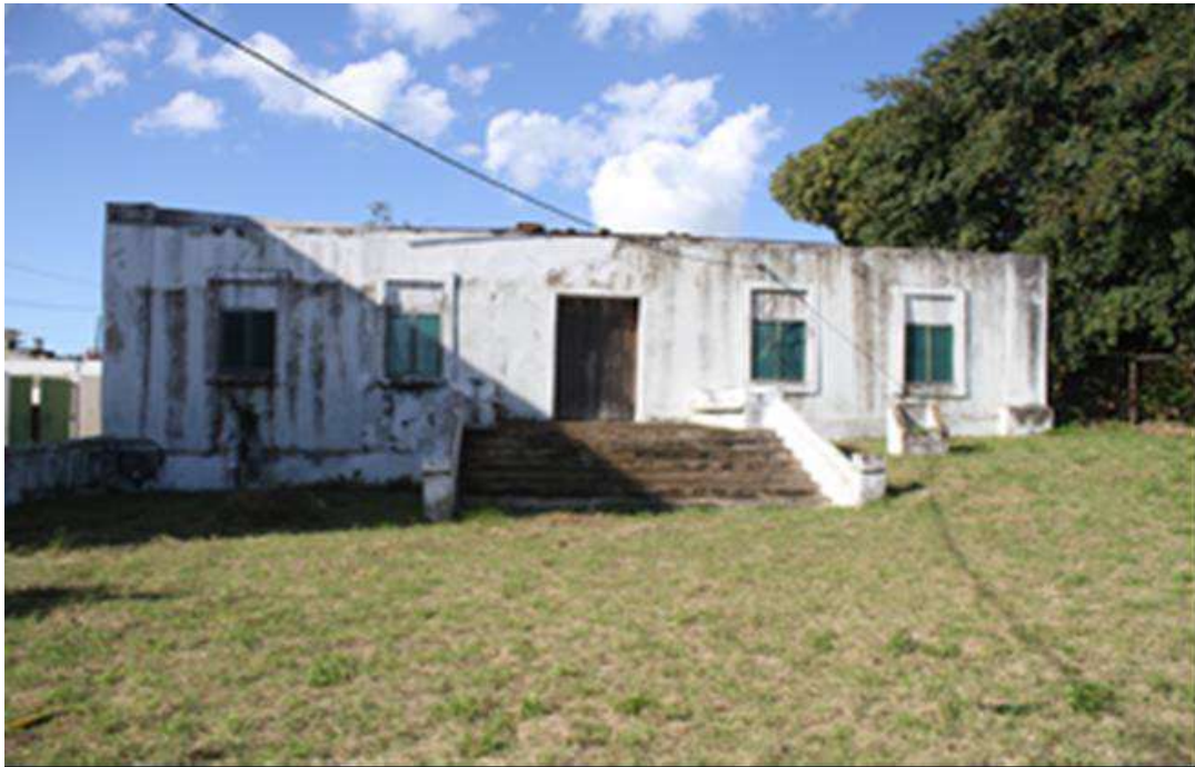
Figura 2: Vista frontal do pórtico das deportações dos escravos

Neste capítulo apresento, baseando-me na legislação Nacional (Lei nº 10/88, de 22 de Dezembro; Resolução nº 12/2010, de 2 de Junho; Decreto nº 55/2016, de 28 de Novembro) e Internacional (Convecção da UNESCO 1972), os procedimentos técnicos para a classificação do monumento do pórtico das deportações dos escravos, como património cultural de valor local e nacional.