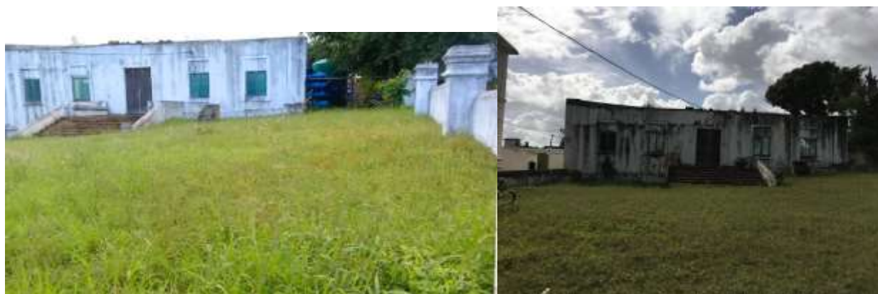
Figura 4, Figura 5: A vegetação afecta a conservação do edifício

No que respeita às causas humanas, os principais factores que contribuem para a deterioração acelerada do pórtico das deportações dos escravos, são: o abandono por parte dos gestores do PC e a vandalização por parte da população (Cháuque em comunicação pessoal, 2023)