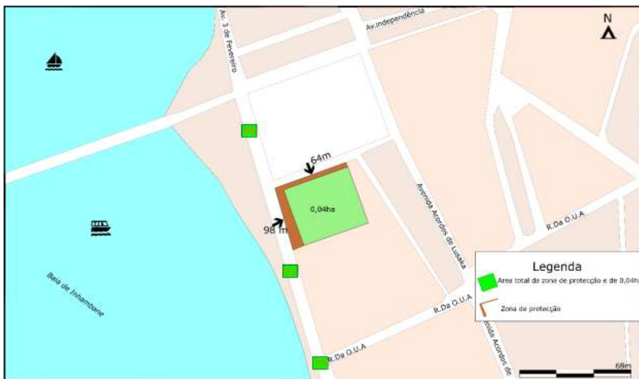
Figura 5: Mapa da zona de protecção do PDE. (elaborado por: Varsil Cossa 2023)

A política de monumentos de Moçambique considera zona de protecção a área envolvente aos monumentos a ser salvaguardada, conforme a legislação internacional. Esta área considera a visibilidade, volumetria o desenho arquitectónico, a articulação entre o interior e o exterior e demais exigências de protecção do imóvel. Qualquer obra ou intervenção a ser feita nesta zona carece de parecer prévio concedido pelo órgão que superintende o sector da cultura em articulação com o Governo local e de acordo com as normas de conservação e planos de desenvolvimento urbanísticos, ou rurais” (Resolução nr. 12/2010, de 2 de Junho).