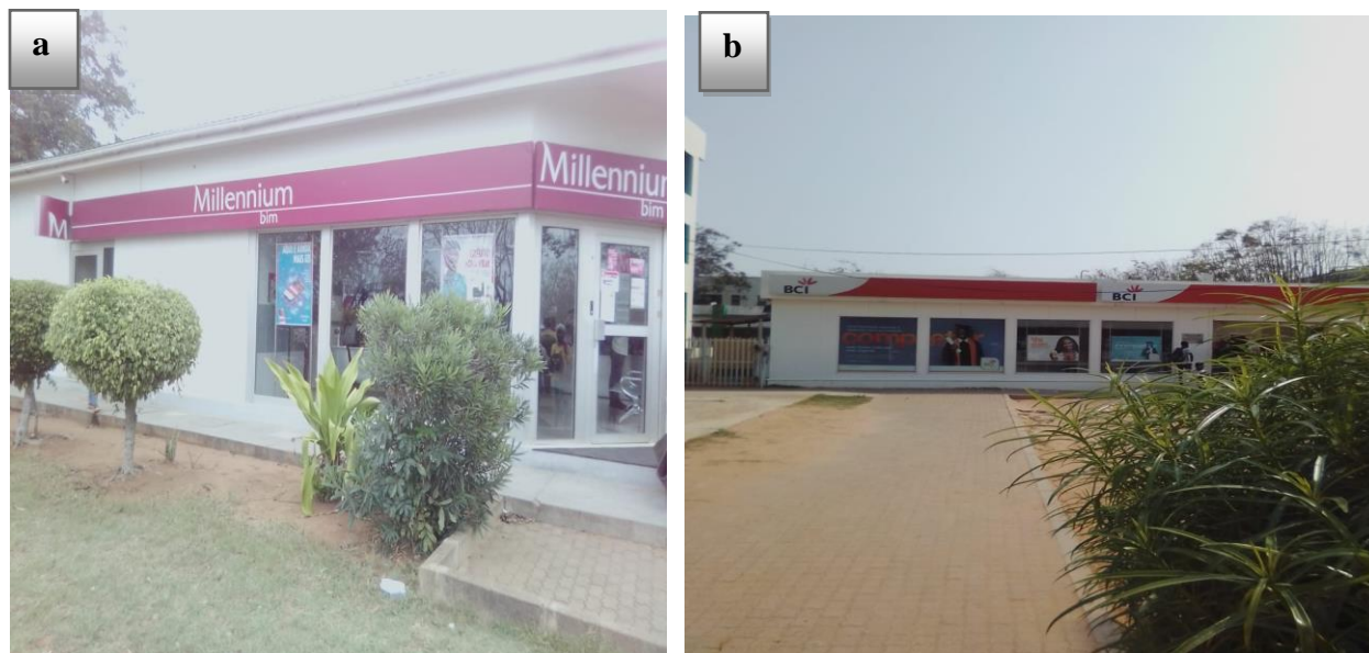
Figura 2: Valor económico da estação arqueológica do Campus Universitário: Agências bancárias de Millennium bim (a) e BCI (b).