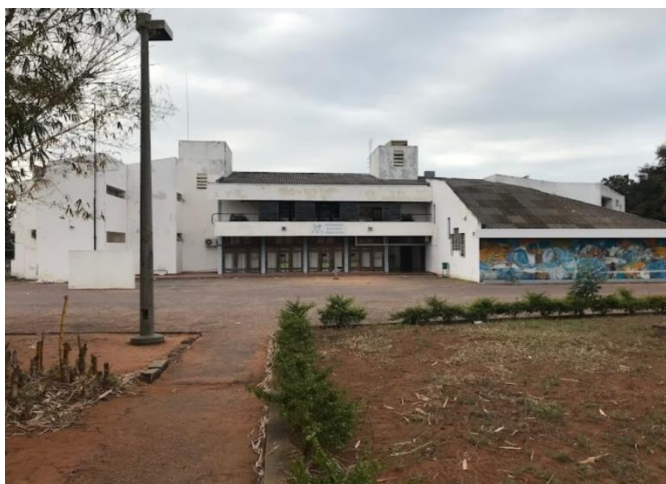
Figura 3: Centro de Estudos Africanos.

Depois da independência o Instituto de Investigação Científico de Moçambique, passou a designar-se Centro de Estudos Africanos criado pelo Aquino de Bragança e Ruth First como uma unidade orgânica da UEM, vocacionada a investigação científica nas áreas das ciências sociais e humanas, com um programa de pesquisas multidisciplinares que inclui o ensino e o debate permanente de ideias e a divulgação de resultados, orientados por um paradigma informado pelas ideias de igualdades, responsabilidade e relevância social ).