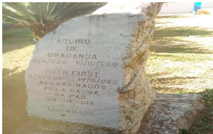
Figura 4: Memorial do Aquino de Bragança e Ruth First.