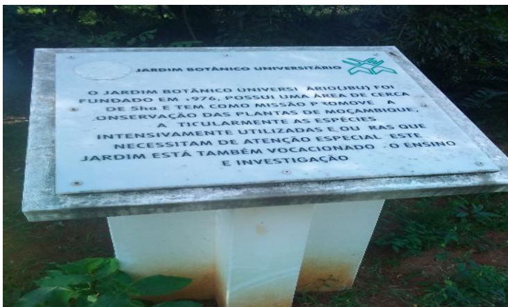
Figura 6: Placa do jardim botânico universitário.

O Jardim botânico universitário (JBU) foi fundado em 1976 e possui uma área de cerca de 5 hectares e tem como missão promover a conservação das plantas de Moçambique, particularmente as espécies utilizadas e outras que necessitam de atenção especial. Este Jardim está também vocacionado ao ensino e educação (retirado da placa de inauguração).