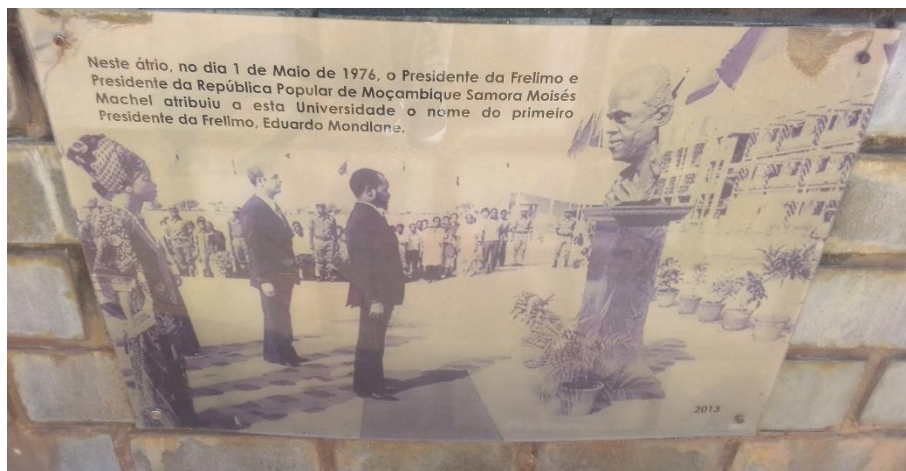
Figura 2: Placa da inauguração da UEM.

No Campus Universitário da UEM, encontra-se uma placa de interesse histórico colocada no âmbito da atribuição ou mudança de nome da então Universidade Lourenço Marquês para Universidade Eduardo Mondlane pelo 1º Presidente Samora Moisés Machel em 1976.