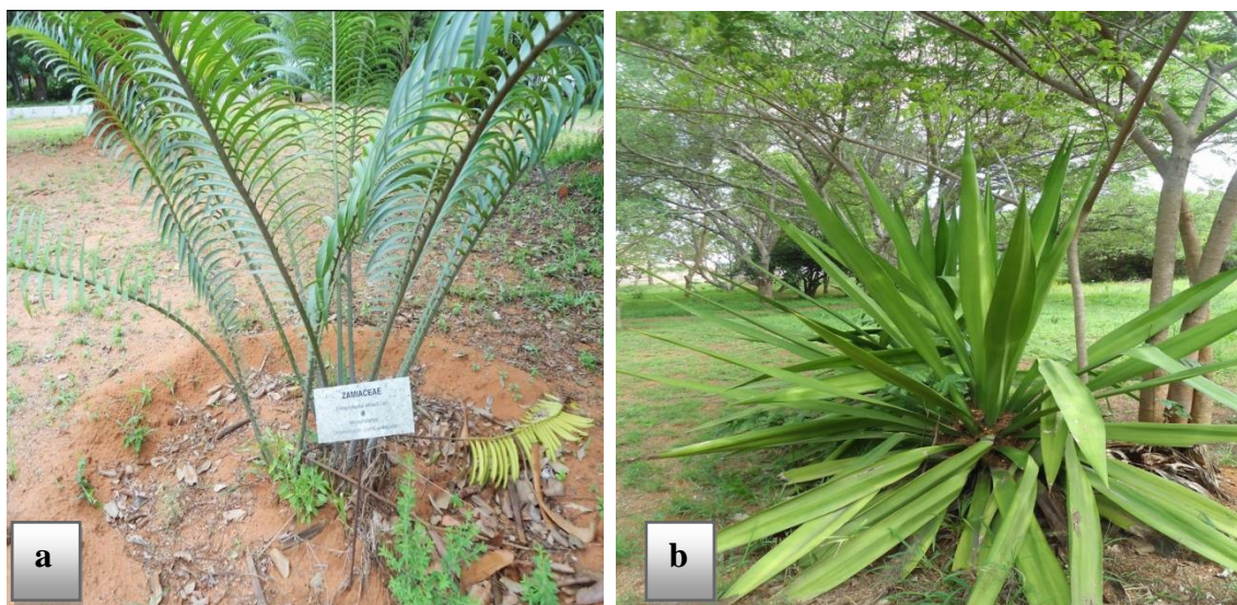
Figura 7: Foto de algumas plantas existentes no jardim botânico a) Encephalartos, oriundo de Goba e b) Agava sp..

O jardim botânico tem ainda a importância de apoiar na investigação em várias áreas, por exemplo, utilização de plantas, melhoramento de plantas fruteiras nativas, estudos de eficácia de plantas medicinais locais, novas plantas ornamentais para o mercado moçambicano. Tem a função de promover as associações para a defesa e divulgação acrescida sobre as plantas.