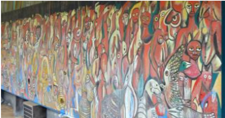
Figura 5: Mural de Malangatana.