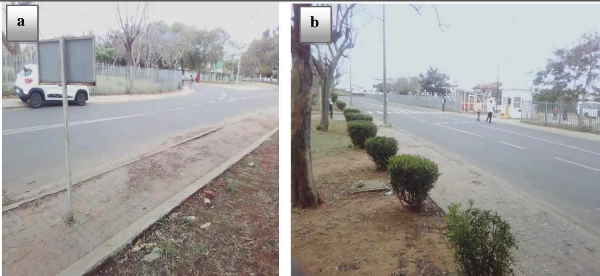
Figura 3: Valor social da estação arqueológica do Campus Universitário: População dos bairros circunvizinhos usando a estação para chegar a outros destinos (a) e (b).