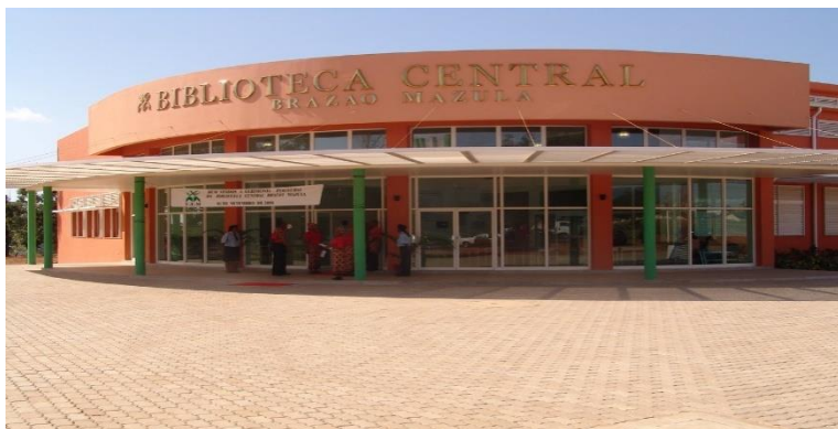
Figura 9: Biblioteca Central Brazão Mazula