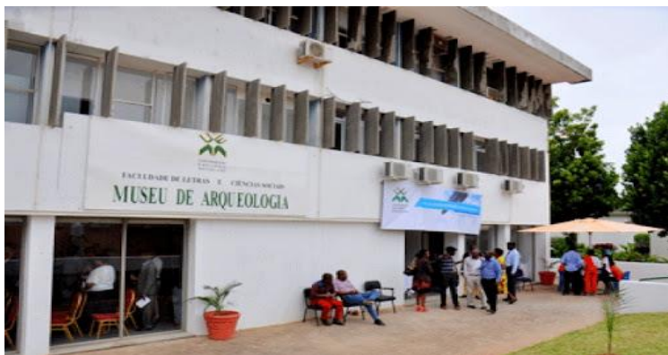
Figura 8: Museu de Arqueologia.

O Museu desempenha um papel importante na preservação, investigação e comunicação da memória colectiva e da cultura material e espiritual do povo moçambicano e de outros povos ao longo da história. Neste contexto, o conceito de museu corresponde a um espaço de preservação, investigação e comunicação do património cultural e natural. Ele engloba, para além das actividades preservação, a interpretação científica do valor informativo do património cultural natural, e a sua comunicação, através de exposições documentadas, ao interesse a comunidade e de actividades, tais como publicações, ciclo de palestras, secções de audiovisuais, oficinas e outros programas educativos (Resolução n° 12/97:41).