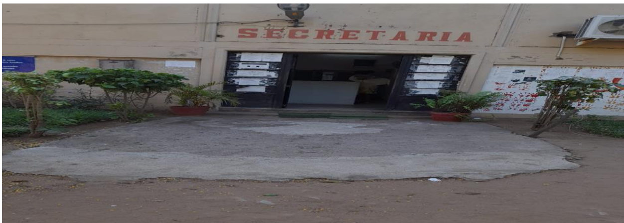
Figura: Imagem da Escola Secundária da Machava Sede