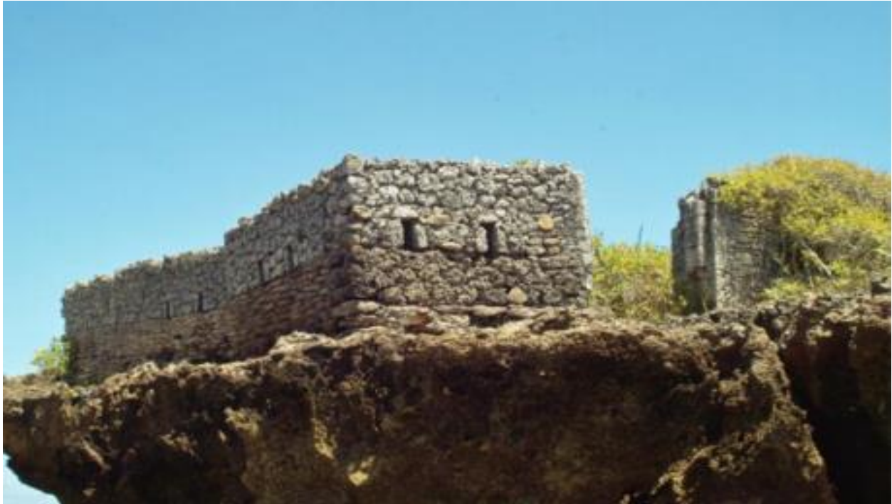
Figura 3. Construção de Somaná (Duarte 1993)

composta por ruínas com casas construídas com pedras de corais e pintadas de cal feito de conchas, como características comuns em muitos centros arqueológicos costeiros do norte de Moçambique (Duarte 1993: 65, Marrame 2018). Para Duarte (1993), Somaná é uma das importantes cidades Swahili, no norte da Província de Nampula, devido à arquitectura clássica Africana que a estação apresenta, sendo datada dos séculos XIII-XIV AD (Duarte 1993: 67).