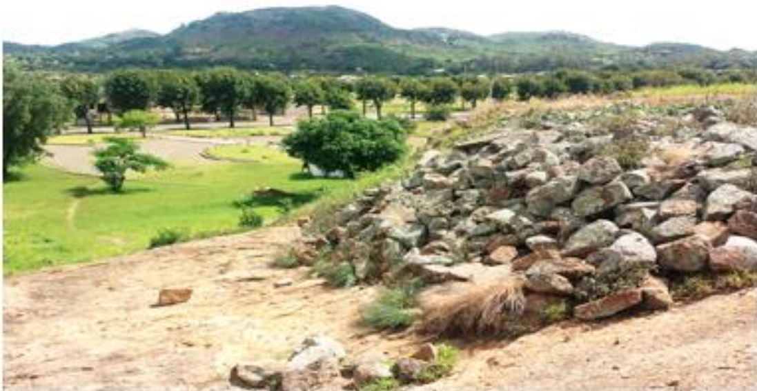
Figura 1. Vista especial da Plataforma do amuralhado de Songo

A sua plataforma foi erguida numa posição central do planalto, sendo rodeada de montanhas o que contribuiu para a formação de uma paisagem cultural peculiar (Macamo 2011: 5). Os habitantes deste centro na época, teriam escolhido um lugar privilegiado dada as condições que esta parte do vale do Zambeze proporciona para a prática da agricultura e para uma fixação permanente (Macamo 2006).