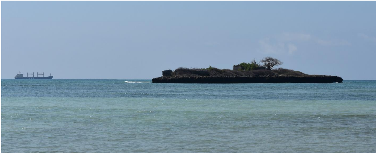
Figura 2. Vista das construções de Somaná no distrito de Nacaça-a-Velha

Somaná é uma antiga cidade costeira, ou antigo centro urbano, que foi identificado por uma equipa da UEM dirigida por Ricardo Teixeira Duarte em 1983. A cidade encontra-se em uma pequena ilha de fácil acesso através de pequenas embarcações, mas de difícil acesso para grandes embarcações, que não podem aproximar-se ao local devido a baixios e recifes de corais em águas rasas (Duarte 1993).